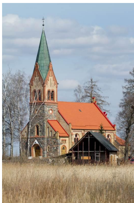
Kościół w Bajtkowie

Na południowy zachód od Ełku, w dawnej niemieckiej miejscowości nad Jeziorem Bajtkowo, na krawędzi doliny zalewowej wznosi się wzgórze pamiętające czasy Jaćwingów. Znajdowało się tam dwupłaszczyznowe grodzisko. Dwie prawie jednakowej wielkości półkoliste platformy otoczone są owalnym wałem. Na niższym majdanie stoi obrobiony kamień, który w wyobraźni pasjonatów Jaćwieży łączony jest z pogańskim kultem Bałtów. Grodzisko zostało zarejestrowane na przełomie XIX i XX wieku przez archeologów niemieckich.