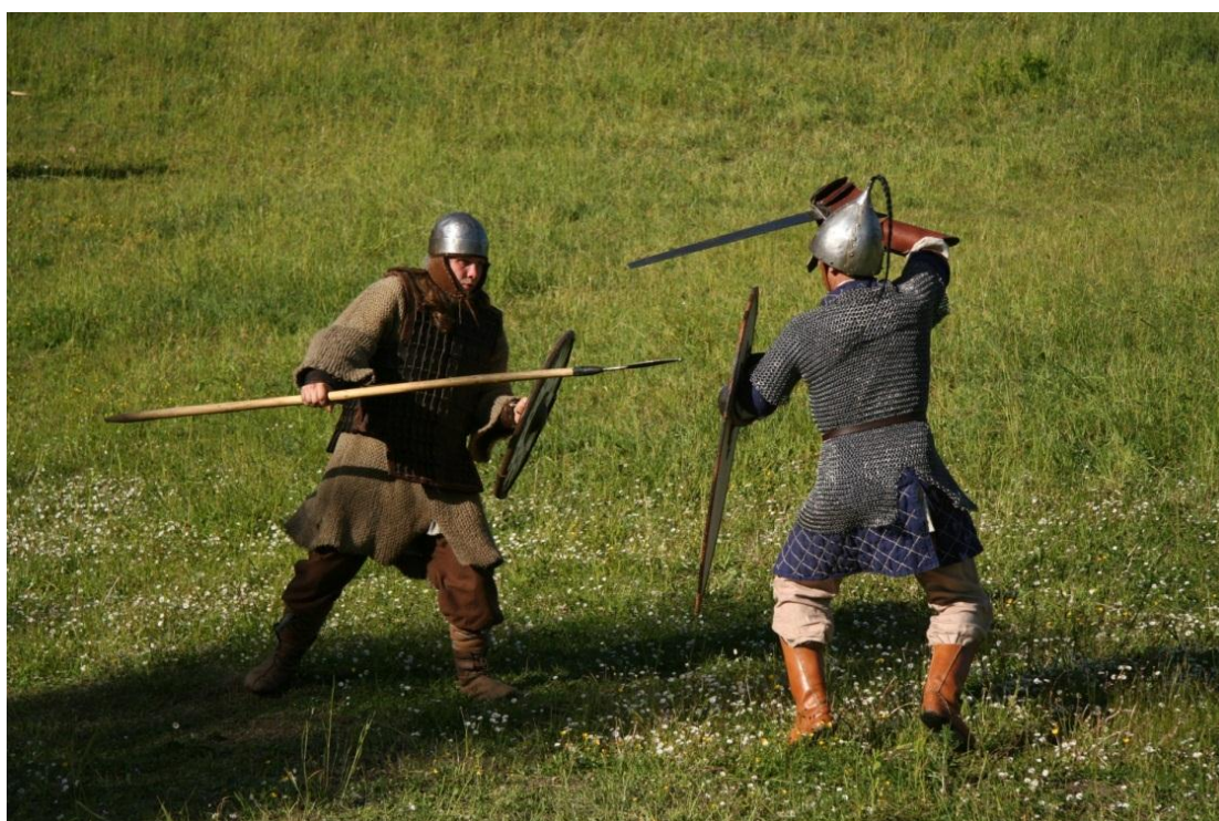
Inscenizacja walki wojów podczas Festynu Jaćwieskiego „Szwajcaria”

Niepiśmienni Jaćwingowie nie pozostawili po sobie źródeł pisanych. Jedyne zapiski na temat ich obyczajów znajdziemy u kronikarzy z wrogich krajów sąsiednich. Nasz Jan Długosz tak pisał o dzielnych Jaćwingach: „To ludy dzikie, wojownicze i tak bardzo żądne sławy i pamięci, że dziesięciu spośród nich walczyło ze stu wrogami, zachęconych tą jedyną nadzieją i świadomością, że po śmierci i zagładzie ziomkowie będą ich sławić pieśniami o dzielnych czynach.”