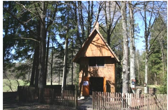
Kapliczka w Świętym Miejscu

Na tym odcinku podążania śladami Jaćwingów masz niepowtarzalną szansę, by przemierzyć trasę kajakiem! Wybierz się na spływ malowniczą Rospudą, poprzez jeziora Augustowa, by trasę zakończyć odcinkiem rzeki Netty lub Kanału Augustowskiego.