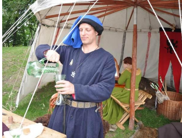
Jedno ze stoisk na pikniku historycznym w Olecku