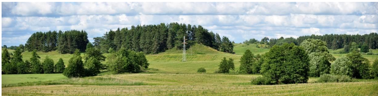
Panorama z grodziskiem w Dąbrowskich.

Weryfikujący założenia obronne niemiecki badacz Guise stwierdził w okolicy jeszcze jedno grodzisko. Dziś trudno jednoznacznie stwierdzić, o które stanowisko chodziło. Na południe od wsi, poza „Szwedzkim Szańcem” wyróżnić można bowiem jeszcze trzy inne wzgórza o stromych zboczach, regularnym kształcie i wyraźnym plateau. Każde z nich mogło w przeszłości pełnić funkcje obronne.