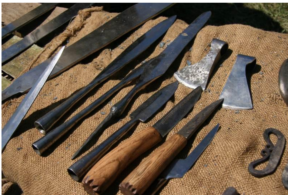
Repliki broni i narzędzi jaćwieskich

Nekropolie nad Gołdapą eksplorowane były już od połowy XIX wieku. Wykopaliska prowadzili niemieccy badacze, w tym wybitny archeolog Otto Tischler. Zabytki odkryte na stanowiskach trafiły do muzeum Prus Wschodnich w Królewcu i niestety zaginęły w czasie II wojny światowej. Tylko niewielki ich procent odnalazł się w magazynach berlińskiej placówki muzealnej.