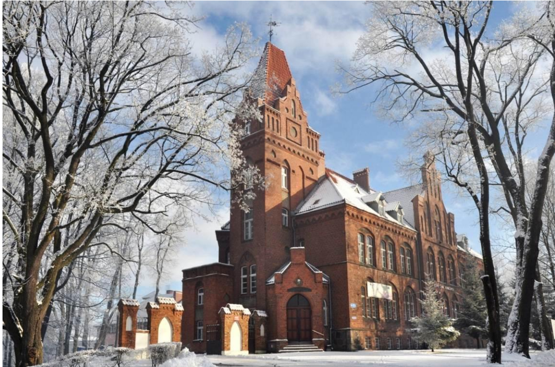
Wzgórze Zamkowe w Olecku

Dziś na wzgórzu zamkowym stoi budynek Zespołu Szkół Technicznych, przedwojenna siedziba starostwa powiatowego. Przy szkole zawiązało się Stowarzyszenie Aktywnych „Zamek” zrzeszające miłośników historii regionu. Organizuje ono liczne imprezy, m.in. Zamkowe Spotkania z Historią, a także opiekuje się ekspozycją zabytków związanych z przeszłością Ziemi Oleckiej.