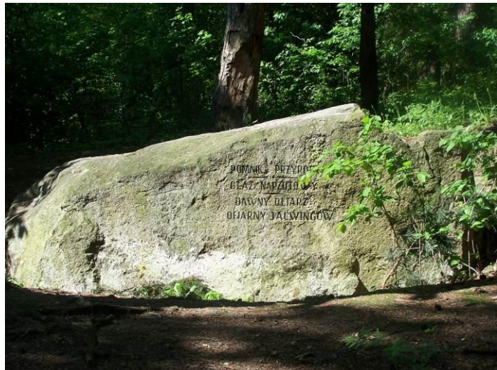
„Kamień ofiarny” w Starych Juchach

Od kilku lat w Starych Juchach na początku sierpnia odbywa się Piknik Jaćwieski. Jedną z atrakcji imprezy nad jeziorem Jędzelewo jest oblężenie grodu Jaćwingów przez Krzyżaków oraz turniej jaćwieski.