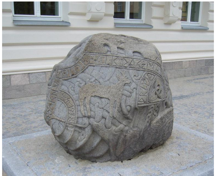
Pomnik poświęcony prof. Falkowi przed siedzibą Muzeum Okręgowego