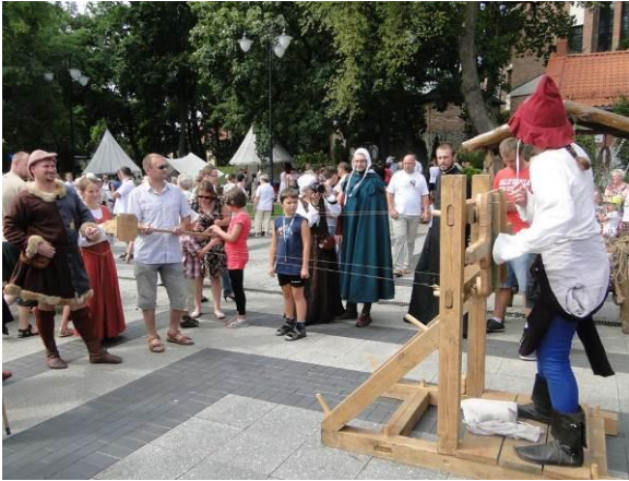
Pokazy powroźnictwa na pikniku historycznym w Olecku