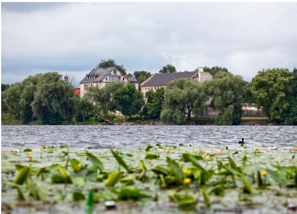
Widok na wyspę z zamkiem w Ełku