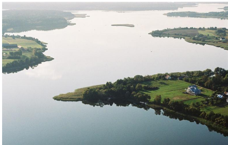
Widok na Jezioro Rajgrodzkie

Na terenie miasta, nad wschodnim brzegiem jeziora Rajgrodzkiego góruje wzniesienie zwane „Zamczyskiem”. Tajemnicza nazwa ma swoje uzasadnienie w historii. W XIV wieku Kazimierz Wielki nakazał tu zbudować zamek, wcześniej zaś znajdowało się tutaj jaćwieskie grodzisko. Najpewniej w połowie XIII wieku Jaćwingowie bronili swych ziem przed wojskami księcia Daniela. Kronika ruska opisująca zimową wyprawę władcy halicko-włodzimierskiego na Jaćwież odnotowuje nazwę grodu Raj. Grodzisko w Rajgrodzie jest położone na półwyspie - z jednej strony wrzyna się stromo w jezioro, z trzech pozostałych oblane jest wodami jeziora. Wybitne walory obronne wzgórza sprawiły, że niepotrzebne tu były dodatkowe obwałowania. Z czworokątnej wierzchołka roztacza się malownicza panorama.