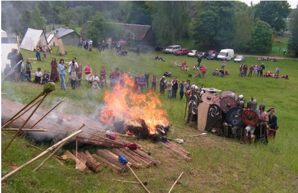
Rekonstrukcja pogrzebu wodza w trakcie Festynu Jaćwieskiego „Szwajcaria”

Na wzgórzu sąsiadującym z cmentarzyskiem, gdzie do tej pory stoją baraki pół wieku temu zajmowane przez ekspedycję archeologiczną, co roku odbywa się Festyn Jaćwieski „Szwajcaria”. Impreza organizowana przez Muzeum Okręgowe w Suwałkach ma już 13-letnią historię i jest największym w Polsce wydarzeniem poświęconym kulturze Jaćwingów. Odwiedzając Szwajcarię w pierwszy weekend lipca można przenieść się w czasie, doświadczając historii wszystkimi zmysłami! Jest to doskonała okazja do wzięcia udziału w tajemnych ceremoniach, zobaczenia walki wojów, skosztowania jaćwieskiej strawy, wypróbowania się w codziennych zajęciach i rzemiosłach sprzed wieków!