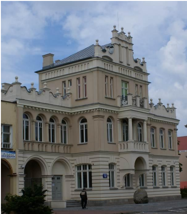
Budynek Muzeum Okręgowego w Suwałkach

Wędrowkę po obiektach archeologicznych Suwalszczyzny najlepiej zacząć od stolicy regionu. Tu w 1956 roku, zaraz po zakończeniu pierwszego sezonu badań cmentarzyska w Szwajcarii, w budynku Resursy Obywatelskiej przy głównej ulicy miasta otwarto niewielką wystawę znalezisk z badań, dając początek społecznego muzeum, dziś Muzeum Okręgowego w Suwałkach.