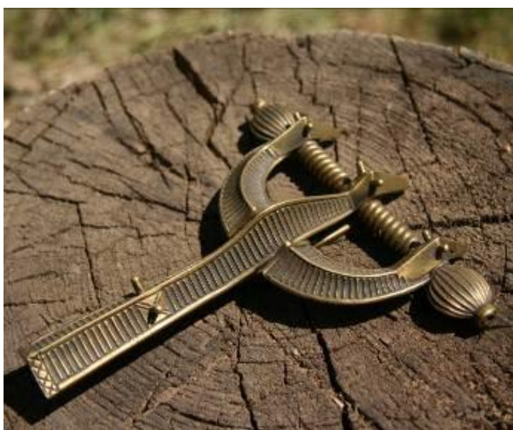
Replika biżuterii jaćwieskiej