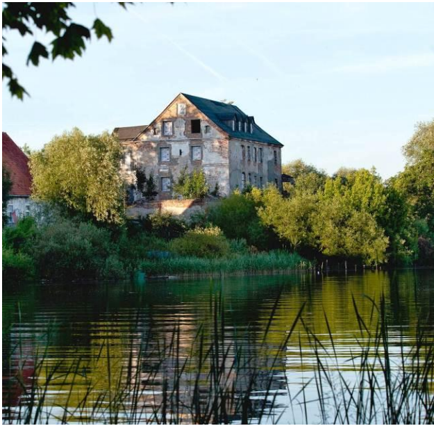
Zamek na jeziorze Elckim

Wyspę na Jeziorze Elckim można zwiedzić również z wody, korzystając z wypożyczalni kajaków i rowerów wodnych: