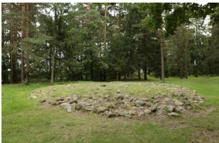
Kurhan na cmentarzysku w Szwajcarii