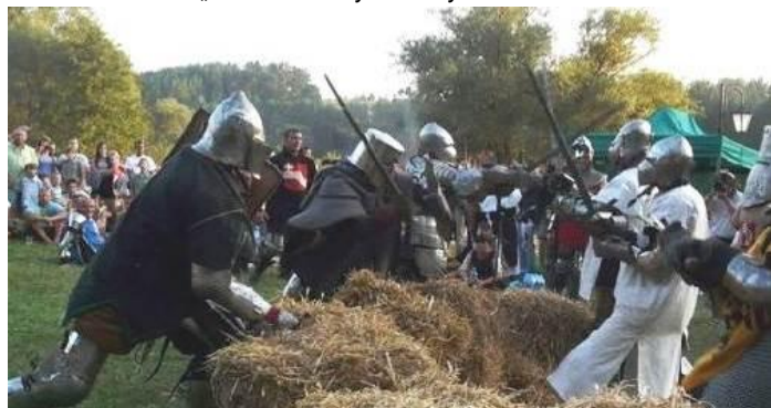
Piknik Jaćwieski w Starych Juchach