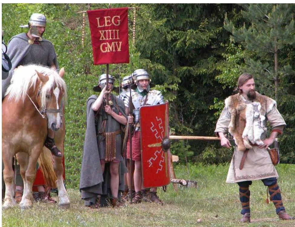
Inscenizacja wyprawy ekwity rzymskiego po bursztyn podczas Festynu Jaćwieskiego „Szwajcaria”

Jaćwingowie należą do ludu Bałtów, który pojawił się na naszych ziemiach już wiele wieków przed Słowianami. Przywędrowali tu z południowego wschodu, z terenów leżących w dorzeczu Dniepru. Sama nazwa „Jaćwingowie” po raz pierwszy pojawia się w latopisie ruskim dopiero w 983 r.n.e., w kontekście wyprawy wojennej księcia Włodzimierza na te tereny. Najprawdopodobniej mamy jednak do czynienia z ciągłością osadnictwa na tych ziemiach od wczesnej epoki żelaza. Bałtowie weszli na karty historii w II wieku naszej ery, za sprawą „Geografii” greckiego autora Ptolemeusza. Zarejestrował on dwa plemiona Galindai i Sudinoi , które identyfikuje się ze średniowiecznymi Galindami, inaczej mówiąc Prusami i Sudowami, czyli Jaćwingami.