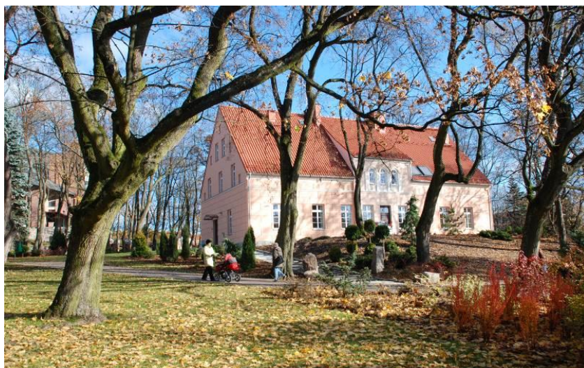
Olecka Izba Historyczna

Olecka Izba Historyczna czwartki–piątki 9.00–17.00 Plac Wolności 1, Olecko tel.+48 517 344 919