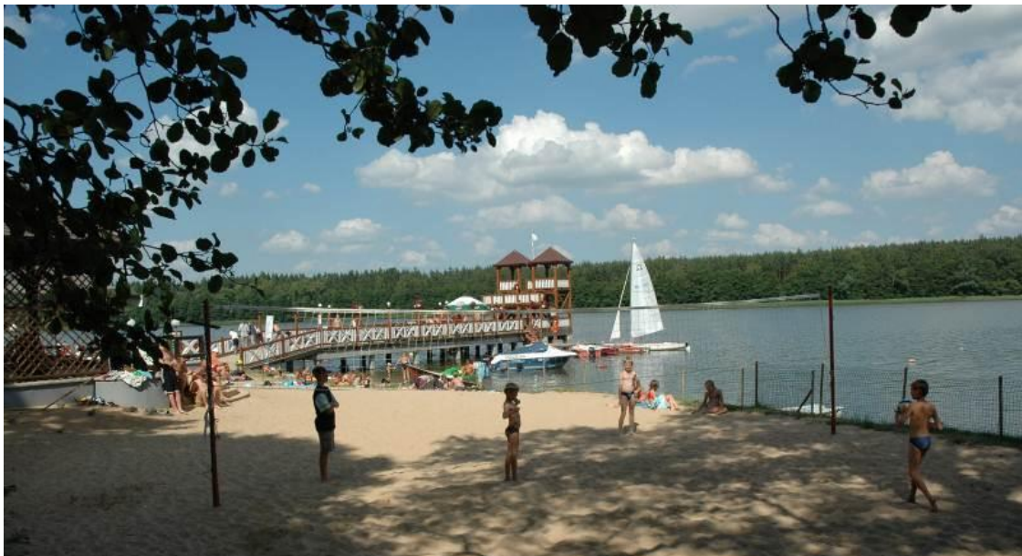
Siatkówka na plaży w Olecku

Na brzegu jeziora znajduje się jedna z największych atrakcji miasta – zabytkowe molo i drewniana skocznia z początku lat 30-tych XX wieku. Jest to część Centrum Sportowo-Rekreacyjno-Kulturalnego w Olecku. Dziś wraz ze swoją białą wieżą stanowi symbol miasta. Latem na plaży miejskiej w tym miejscu odbywa się wiele imprez sportowych i kulturalnych. Jest tu także boisko do siatkówki plażowej. Dla ukazania piękna oleckiego jeziora, utworzono „Wiewiórczą ścieżkę”. Trasa biegnąca wokół Olecka Wielkiego (długości około 12 km) jest doskonałym miejscem do rowerowych wypraw, biegów czy spacerów nordic walking .