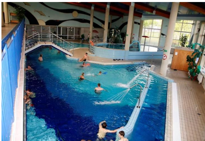
Elcki Park Wodny

Zachęcamy do skorzystania z Parku Wodnego. Czekają tu na państwa wiele atrakcji w postaci masażu wodnych, wodospadów, wodotrysków, biczy wodnych, jacuzzi czy zjeżdżalni. Największa ma 106 m długości. Warto polecić także łóżka do hydromasażu i siłownia wodna. Niemalą gratką są liny do wspinaczki tzw. małpi gaj, beczka oraz kosze do gry w koszykówkę wodną. Po wyczerpującej zabawie, zachęcamy do skorzystania z łaźni parowej, grot lodowej bądź jednej z trzech rodzajów saun: suchej, parowej czy infra-red (podczerwieni).