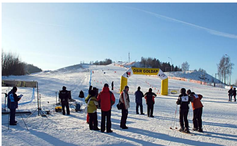
„Światowe Święto Śniegu”

Wszyscy na niego czekają, a gdy się pojawi budzi niemałe zamieszanie - śnieg, zimą tak powszechny, na dwa dni staje się głównym bohaterem Gołdapi. Podczas Światowego Święta Śniegu nie straszny jest nawet mróz. Atmosferę podgrzewa gorąca rywalizacja, wesole zabawy i ogromna dawka humoru. Każdy znajdzie tu coś dla siebie - jednego dnia bieg narciarski, zabawy na lodzie i śniegu przy muzyce oraz konkurs na najpiękniejszą rzeźbę w lodzie i śniegu. Drugiego dnia Slalom Gigant na Pięknej Górze, podczas którego królują narciarstwo alpejskie i snowboard.