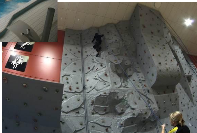
Ścianka wspinaczkowa, OSIR Suwałki