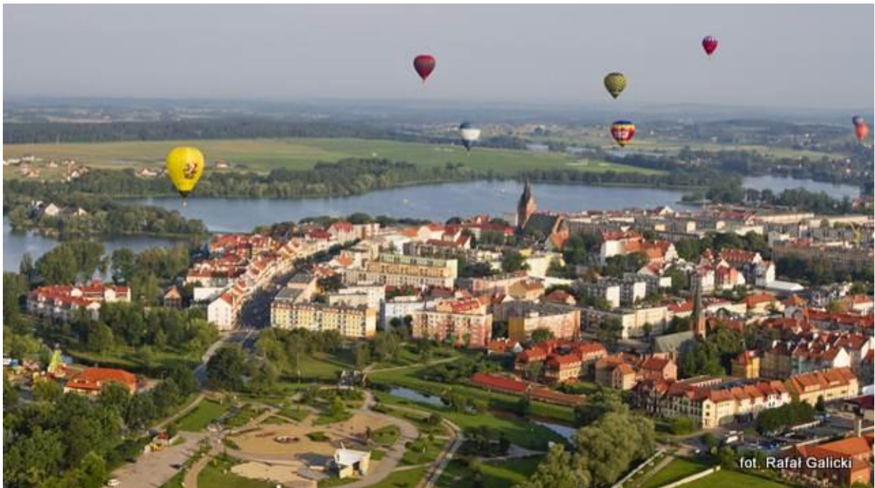
Panorama Elku z balonu

Elk to nie tylko bogata historia i cenne zabytki przeszłości. Jest przede wszystkim żywym, prężnie rozwijającym się miastem, które przyciąga młodych licznymi atrakcjami i szerokim wachlarzem możliwości. Stolica zielonego regionu Mazur Wschodnich, malowniczo położona nad Jeziorem Etckim, zachęca do rozrywki i aktywnego wypoczynku przez cały rok.