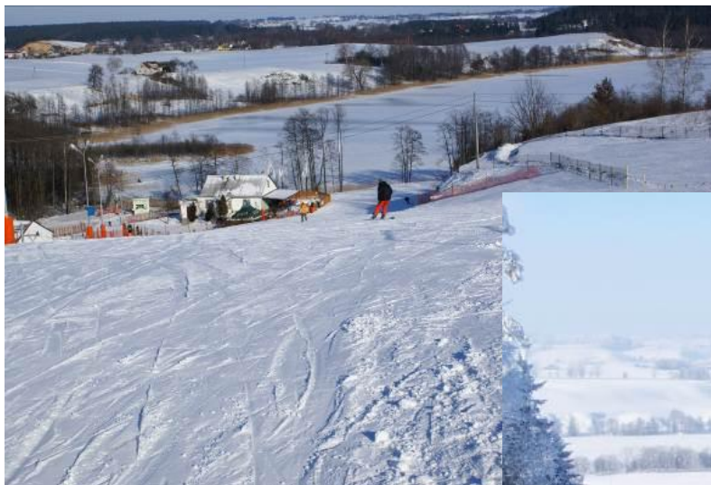
Wyciąg narciarski „Dąbrówka”