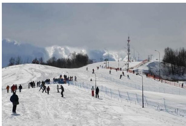
Piękna Góra w Gołdapi