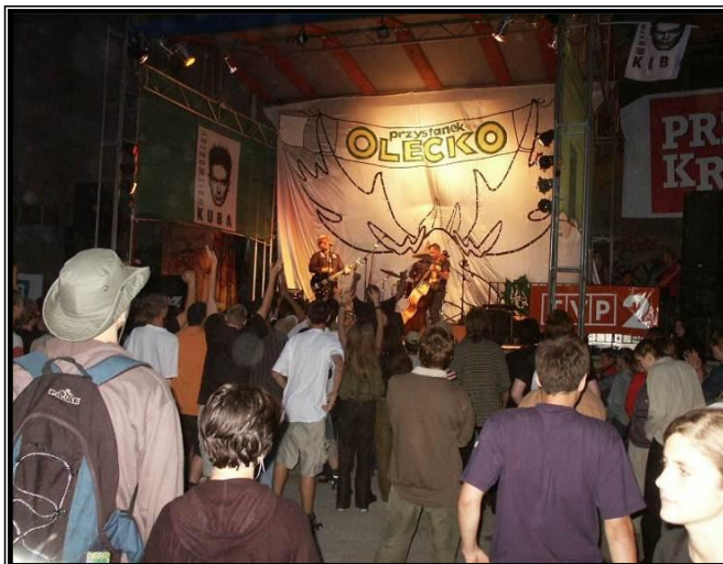
„Przystanek Olecko”, Scena plenerowa przy Placu Wolności

To najbardziej reprezentatywne wydarzenie w mieście. Festiwal organizowany każdego lipca od 1994 roku był przez wiele lat kultową imprezą przyciągającą młodzież z całej Polski. Do dziś jest miejscem wielopokoleniowego, dynamicznego spotkania ludzi, bardzo różnych wiekiem, wykształceniem, zawodem i mentalnością. Na „Przystanku Olecko” króluje muzyka, a oprócz koncertów przez cały tydzień odbywają się warsztaty twórcze, wystawy, spektakle i pokazy. To idealny moment, by rozkoszować się wspaniałą muzyką a jednocześnie obcować wśród ludzi, którzy tworzą niezapomnianą atmosferę.