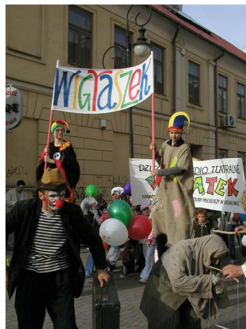
Międzynarodowy Festiwal „Wigraszek

Festiwalowi towarzyszą niezwykle interesujące wystawy rekwizytów teatralnych, warsztaty oraz spektakle w wykonaniu profesjonalnych zespołów teatralnych z całej Europy. Ubarwia go bajeczny korowód młodych artystów i widzów. Zachęcamy do udziału w tej wyjątkowej imprezie co roku w czerwcu.