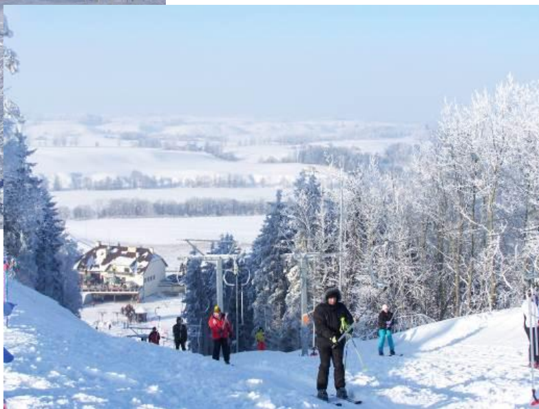
Wyciąg narciarski „WOSIR Szelment”