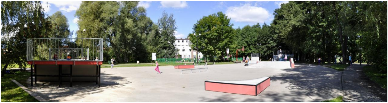
Skatepark nad jeziorem w Olecku

Specjalnie dla miłośników sportów nieco ekstremalnych, niedaleko plaży miejskiej powstał skatepark. Posiada on nowoczesne wyposażenie na najwyższym poziomie. Jest ulubionym miejscem fanów jazdy na rolkach i deskorolce.