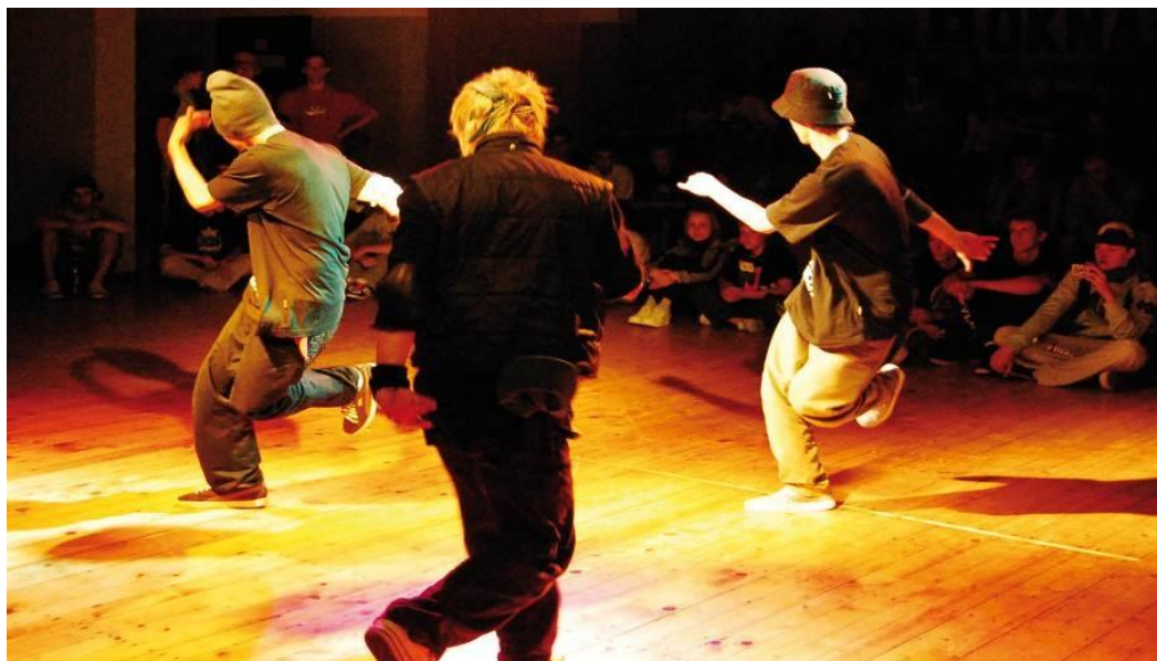
Mazoory Style Connection

To niewątpliwie jedna z największych imprez hiphopowych w północnej Polsce, stworzona z myślą o ludziach zafascynowanych muzyką, tańcem, djingiem czy graffiti. Festiwal przyciąga z roku na rok coraz większą liczbę fanów kultury hip hop z całego kraju a dziedziniec gołdapskiego Domu Kultury pęka w szwach. Zaproszeni goście biorący udział w projekcie to czołówka polskich i światowych tancerzy, DJ-ów, raperów oraz innych utalentowanych artystów.