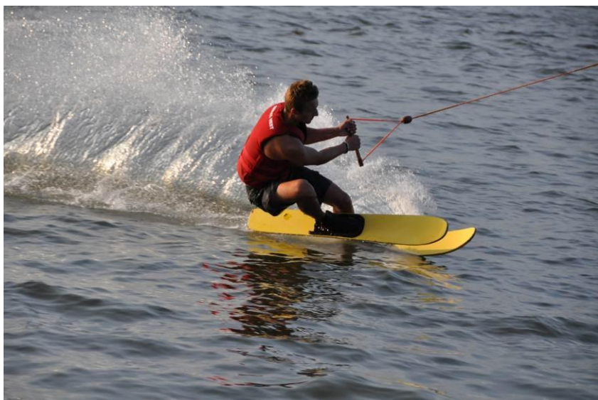
Elektryczny Wyciąg Nart Wodnych w Augustowie

Duży poziom adrenaliny i wszechobecna woda, tak w kilku słowach można scharakteryzować jedną z najlepszych imprez w regionie. Netta Cup to trzydniowa uczta dla miłośników nart wodnych,