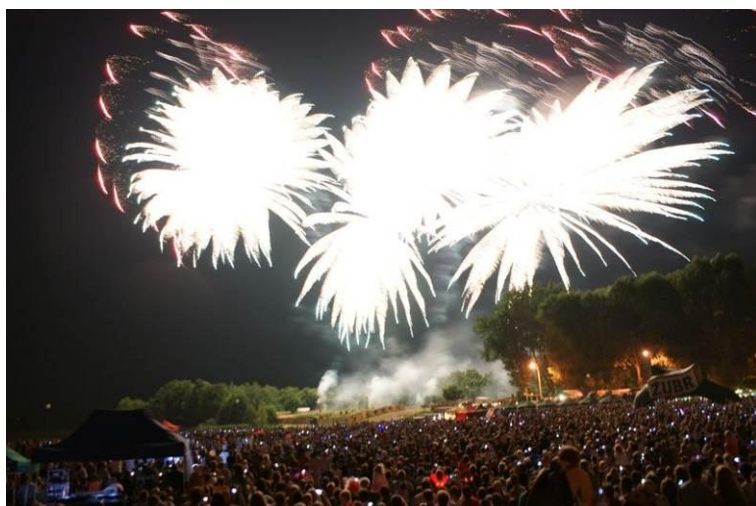
Festiwal Sztuk Pirotechnicznych „Elk, Ogień i Woda

W drugiej połowie lipca w Elku szaleją żywioły. Miejskie niebo rozświetla się za sprawą sztucznych ogni. Festiwal Sztuk Pirotechnicznych „Elk, Ogień i Woda” przyciąga tłumy. Pierwsze dwa dni imprezy skupiają się na pokazach ogniowych w plenerze, ostatniego dnia zaś można obejrzyć zmagania zawodników sportów wodnych: wyścigu kajakowego i maratonu pływackiego. Festiwalowi towarzyszą liczne imprezy artystyczne.