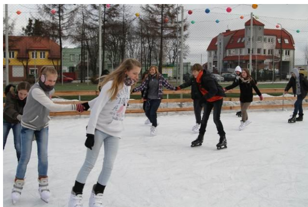
Lodowisko w Gołdapi

Na skraju Lasów Skaliskich i Gór Klewińskich, kilometr od maleńkiej wioski Ściborki, zamieszkałej głównie przez ludność pochodzenia ukraińskiego, leży zakątek o dumnej nazwie „Republika Ściborska” założona przez „Biegnącego Wilka” – Dariusza Morsztyna. Na tym autentycznym odludziu, gdzie nie dociera zasięg telefonu i gdzie dopiero od niedawna można dojechać samochodem, spotykają się amatorzy ekologicznego trybu życia. Działa tu Muzeum Kultury Indiańskiej i Eskimoskiej, psi zaprzęg, prowadzone są zajęcia z dogoterapii, edukacji przyrodniczej i różne „zielone eventy”.