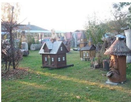
Skansen Pszczelarski przy Ełckiej Kolei Wąskotorowej

ul. Wąski Tor 1, Ełk, tel./fax 87 610 00 00