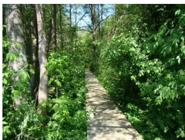
Ścieżka edukacyjna w WPN

W muzeum przygotowano ekspozycję stałą, prezentującą historię nadwigerskiego krajobrazu, głębiny jezior, rzeki, torfowiska i ekosystemy lądowe Wigierskiego Parku Narodowego, działalność człowieka oraz historię i dokonania dawnej Stacji Hydrobiologicznej na Wigrach. Muzeum mieści salę laboratoryjną, przeznaczoną do zajęć edukacyjnych oraz salę projekcyjną - miejsce prezentacji filmów, pokazów przezroczy, seminariów i warsztatów.