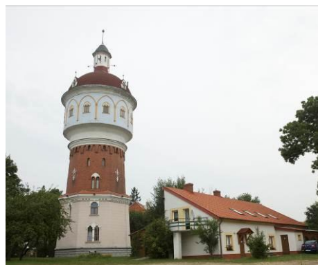
Muzeum Kropli Wody w Ełckiej Wieży Ciśnień