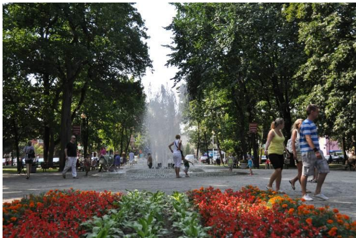
Fontanna w parku w Augustowie

„AUGUSTOWIANKA” sp. z o.o. jest firmą z ponad czterdziestoletnią tradycją w rozlewnictwie naturalnej wody mineralnej „Augustowianka”. Wytwórnia Wód Mineralnych położona w uzdrowskim mieście Augustowie otoczonym kompleksem Puszczy Augustowskiej i jezior, leżącym w strefie wolnej od zanieczyszczeń i zagrożeń ekologicznych eksploatuje, w celu butelkowania naturalnej wody mineralnej, jedno z najgłębszych czynnych studni głębinowych w kraju ujmujące górną jurajską poziom wodonośny.