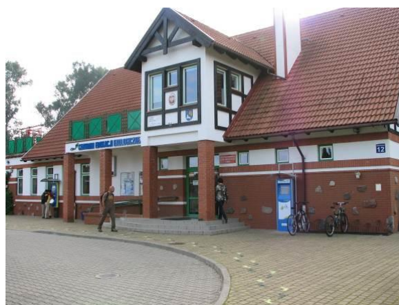
Centrum Edukacji Ekologicznej w Ełku