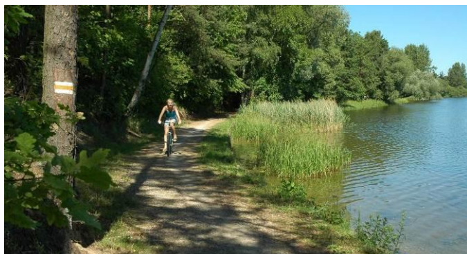
„Wiewiórcza ścieżka“ wokół jez. Oleckie Wielkie

Wokół Jeziora Oleckie Wielkie biegnie pieszo-rowerowy szlak zwany „Wiewiórczą ścieżką”. Ścieżka edukacyjna, o długości 12 km, z przygotowanymi tablicami informacyjnymi i elementami małej architektury z punktami widokowymi jest atrakcją dla małych i dużych ekologów. Na tej urokliwej trasie można zobaczyć objęte prawną ochroną ciekawe gatunki roślin, zwierząt oraz ptaków.