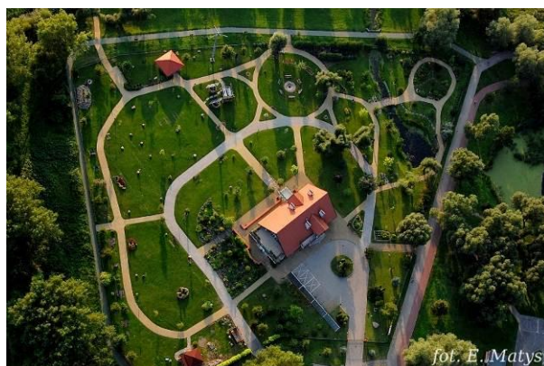
Centrum Edukacji Ekologicznej w Ełku