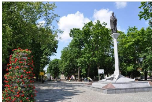
Park w Augustowie