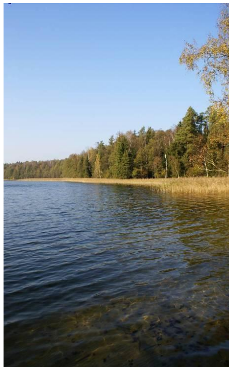
Rezerwat Jezioro Kalejty

Przez Puszcę Augustowską prowadzą liczne szlaki turystyczne: piesze, rowerowe i kajakowe. Jeziora są cenione przez amatorów sportów wodnych oraz wędkarzy.