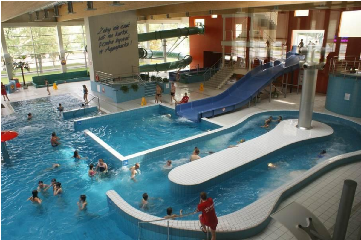
Basen rekreacyjny w Aquaparku Suwałki